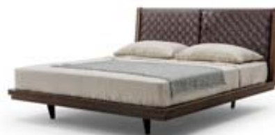
Masivní dřevěná postel Net s oblymi detaily a čelem, které je vypleteno přírodní kůží, působí uklidujícím harmonickým dojmem. Výrobce Turri (www.turri.it)