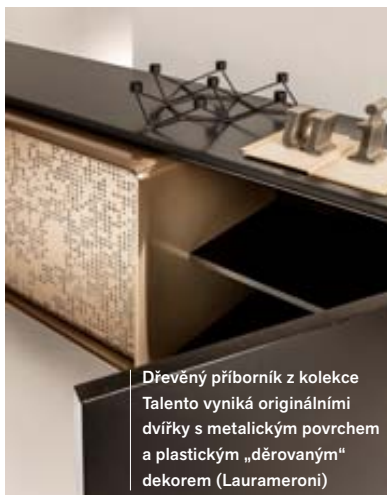
Dřevěný příborník z kolekce Talento vyniká originálními dvířky s metalickým povrchem a plastickým „děrovaným“ dekorem (Laurameroni)