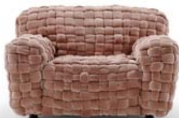
Struktura výpletu dodá jednoduše tvarovanému křeslu Azul atraktivní vzhled. Navrhla designérka Paola Navone pro Turri Design