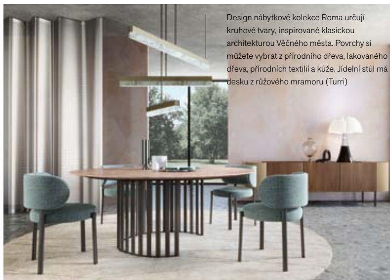
Design nábytkové kolekce Roma určují kruhové tvary, inspirované klasickou architekturou Věčného města. Povrchy si můžete vybrat z přírodního dřeva, lakovaného dřeva, přírodních textilií a kůže. Jídelní stůl má desku z růžového mramoru (Turri)

Barevná škála vychází z neutrálních tónů šedé, hnědé a béžové doplněné o tlumené odstíny modré, zelené, olivové, vínové, starorůžové či hořčicově žluté. Doprovázejí je detaily či intarzie z kovů, převážně v matné úpravě (hliník, nikel, cín, bronz, měď, mosaz apod.). ✱