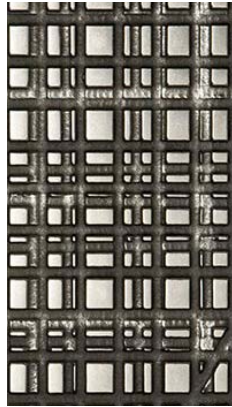
Liquid Metal Tin