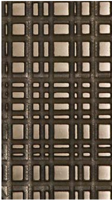
Liquid Metal Light Bronze