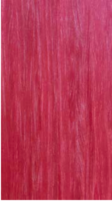
Maple red aniline died

_The finishes shown are indicative and refer to the entire production range. Laurameroni reserves the right to modify the range without warning.