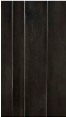
Black Iron "Genere"