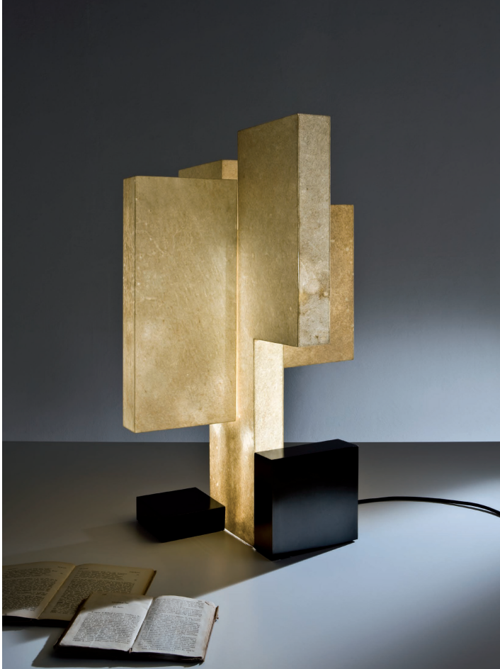
Table lamp with base in burnished brass, diffuser covered in goat parchment and four internal LED strips.

With a simple design and an articulated volume, it represents a tribute to the artistic avant-gardes of the 1930s.