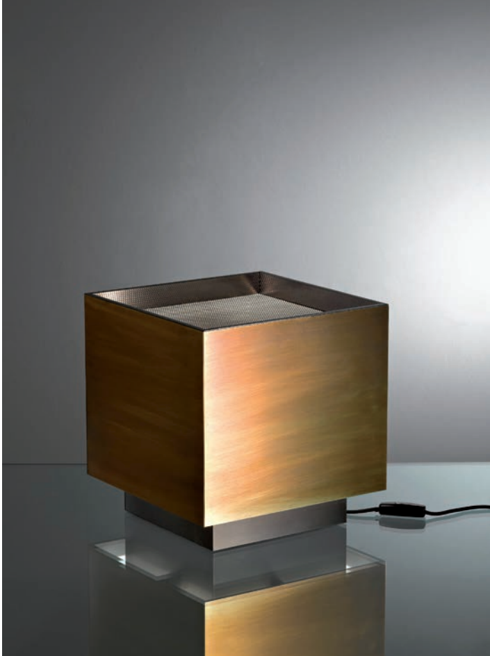
Table lamp with structure in aluminium covered with burnished brass sheets and diffuser in micro perforated stainless steel. Light Cube has an elegant cubic shape and can be used both on the table or on the floor.

Light Cube is designed to project the light upward through the diffuser. As a result, the light filters from the base creating the surprising effect of a floating cube.