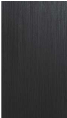
Brushed mat lacquered