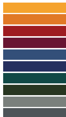
Available in all RAL / NCS colors

_The finishes shown are indicative and refer to the entire production range. Laurameroni reserves the right to modify the range without warning.