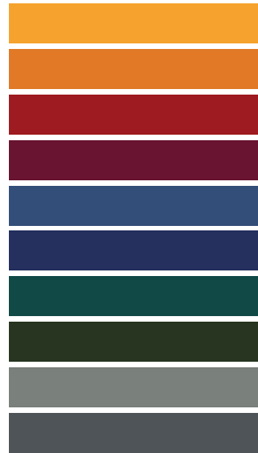
Available in all RAL / NCS colors

_The finishes shown are indicative and refer to the entire production range. Laurameroni reserves the right to modify the range without warning.