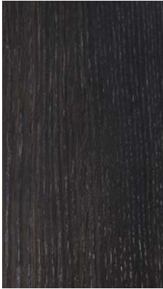
Stone Oak Carbone