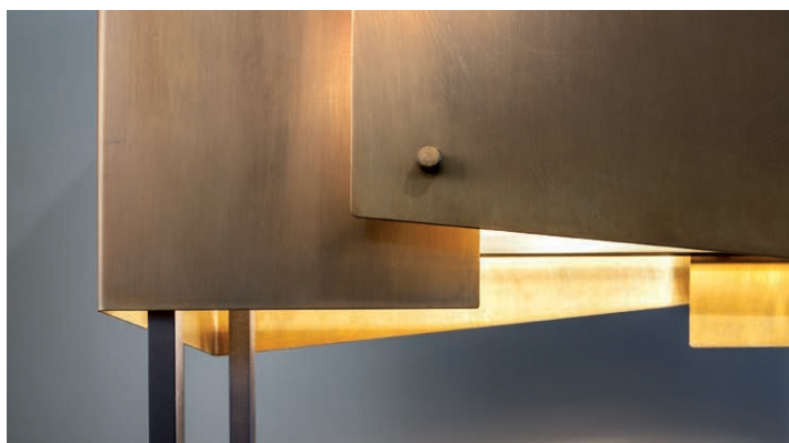
Table Lamp ha una struttura in ottone nichelato nero, coperture in ottone brunito e lampadina alogena. L'attenzione ai dettagli e il sofisticato design rendono Table Lamp un prodotto unico in cui l'abilità degli artigiani nell'uso e nella valorizzazione dei materiali è immediatamente visibile.

Table Lamp has a structure in black nickel-plated brass, shades elements in burnished brass and halogen bulb. The attention to details as well as the sophisticated design make Table Lamp a unique product in which the ability of the craftsmen in using and giving value to the materials is immediately visible.