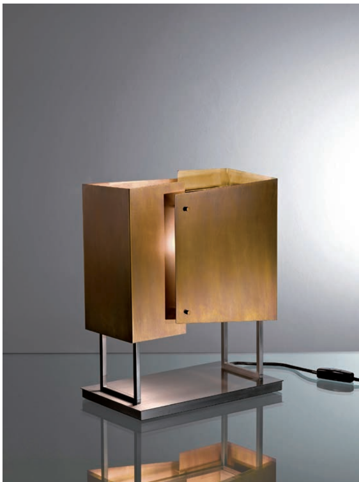
Table Lamp has a structure in black nickel-plated brass, shades elements in burnished brass and halogen bulb. The attention to details as well as the sophisticated design make Table Lamp a unique product in which the ability of the craftsmen in using and giving value to the materials is immediately visible.

Table Lamp ha una struttura in ottone nichelato nero, coperture in ottone brunito e lampadina alogena. L'attenzione ai dettagli e il sofisticato design rendono Table Lamp un prodotto unico in cui l'abilità degli artigiani nell'uso e nella valorizzazione dei materiali è immediatamente visibile.