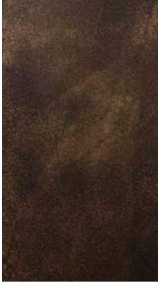
“Patina bronzata antica”

_The finishes shown are indicative and refer to the entire production range. Laurameroni reserves the right to modify the range without warning.