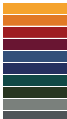
Available in all RAL / NCS colors

_The finishes shown are indicative and refer to the entire production range. Laurameroni reserves the right to modify the range without warning.